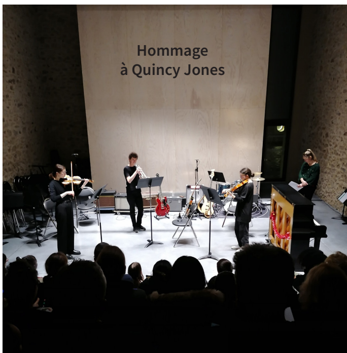
ÉCOLE DE MUSIQUE DIMANCHE 15 JUNI 2025 À 17H30