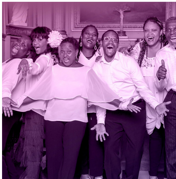
KAN MÊM PRO VENDREDI 13 JUNI 2025 À 20H30