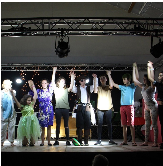
CAP THÉÂTRE SAMEDI 7 JUNI 2025 À 20H30

Au mois de juin, la ferme des Tournelles ouvre ses portes aux associations de la commune pour leur représentation de fin d'année scolaire.